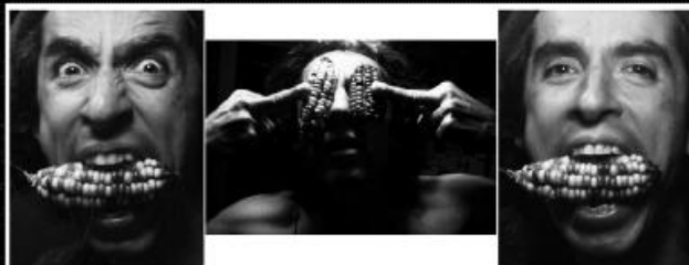
EL 28 DE OCTUBRE DEL 2004 MONSANTO CORPORATION PATENTÓ EL ADN DEL MAÍZ. ACCIÓN QUE PONE EN PELIGRO EL DERECHO DE SEMBRAR MAÍZ.